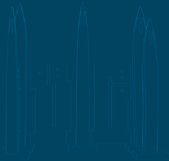
Historische Pfähle aus der Elbe- Pfahlskulpturen an der Elbe

BRÜCKEN-GRÜNDUNGSPFÄHLE AUS DER ELBE ZOLLBRÜCKE MAGDEBURG UM 1700